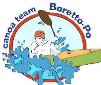
CANOA TEAM BORETTO PO