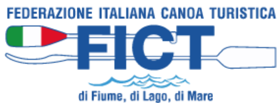
FEDERAZIONE ITALIANA CANOA TURISTICA