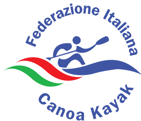
FEDERAZIONE ITALIANA CANOA KAYAK