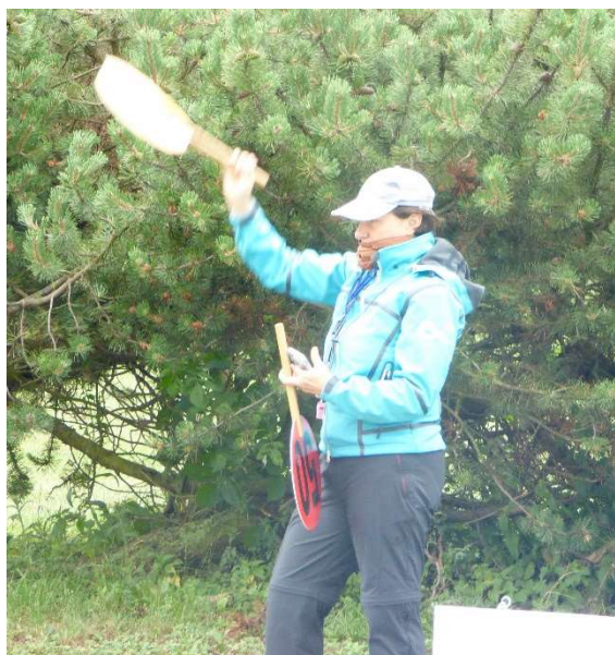
Impegnata fra smartphone (a portata di pollice sinistro) e palette

Lo SPI: ogni dispositivo ha il nome del Giudice e le porte assegnate: mano a mano che si completano gli invii delle penalità, il n. di pettorale scorre al successivo. Anche la X consente le correzioni. E' inoltre possibile chiedere la review specificando il n. di porta sulla quale si fa la richiesta.