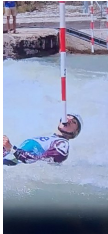
..... anche le donne dimostrano di non aver più paura di