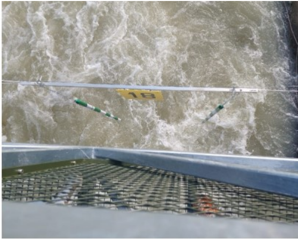
La porta 18, la postazione del giudice è sul ponte