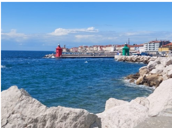
Il caratteristico borgo di Tiran,

seguito da un pranzo sulla costa nel caratteristico villaggio di Tiran e per finire un gelato a Portorose