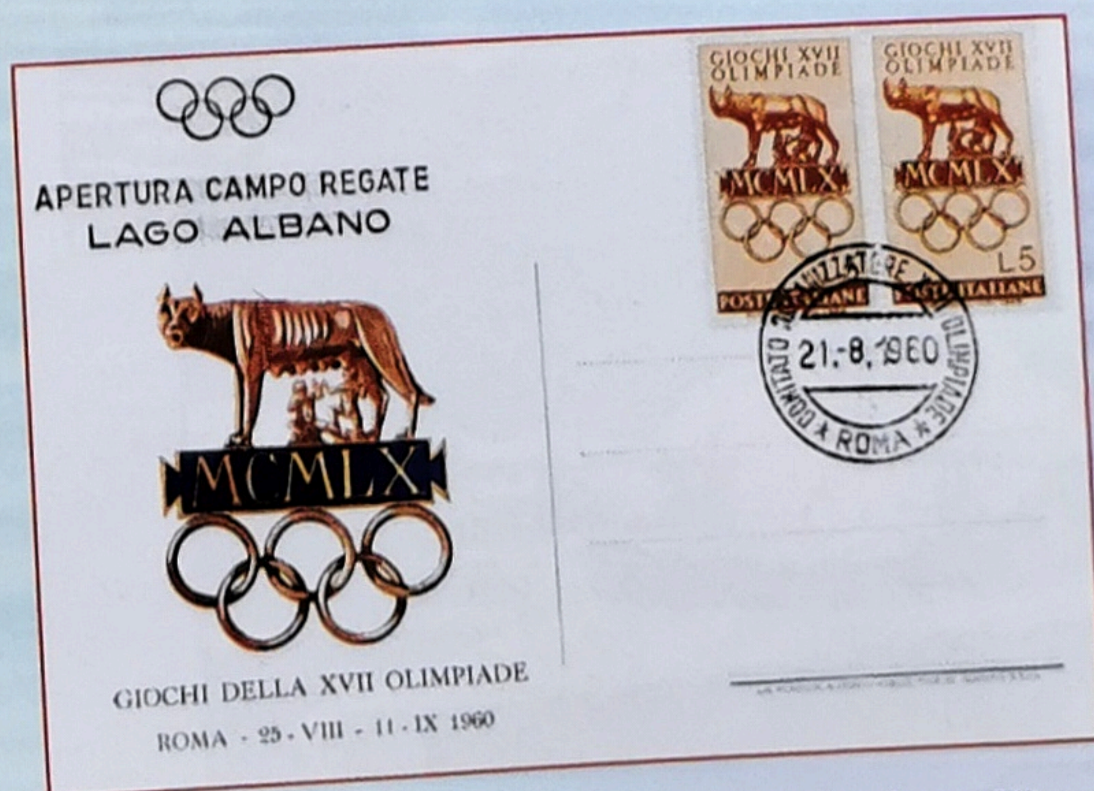
21.8.60 - Apertura campo regate - Lago Albano