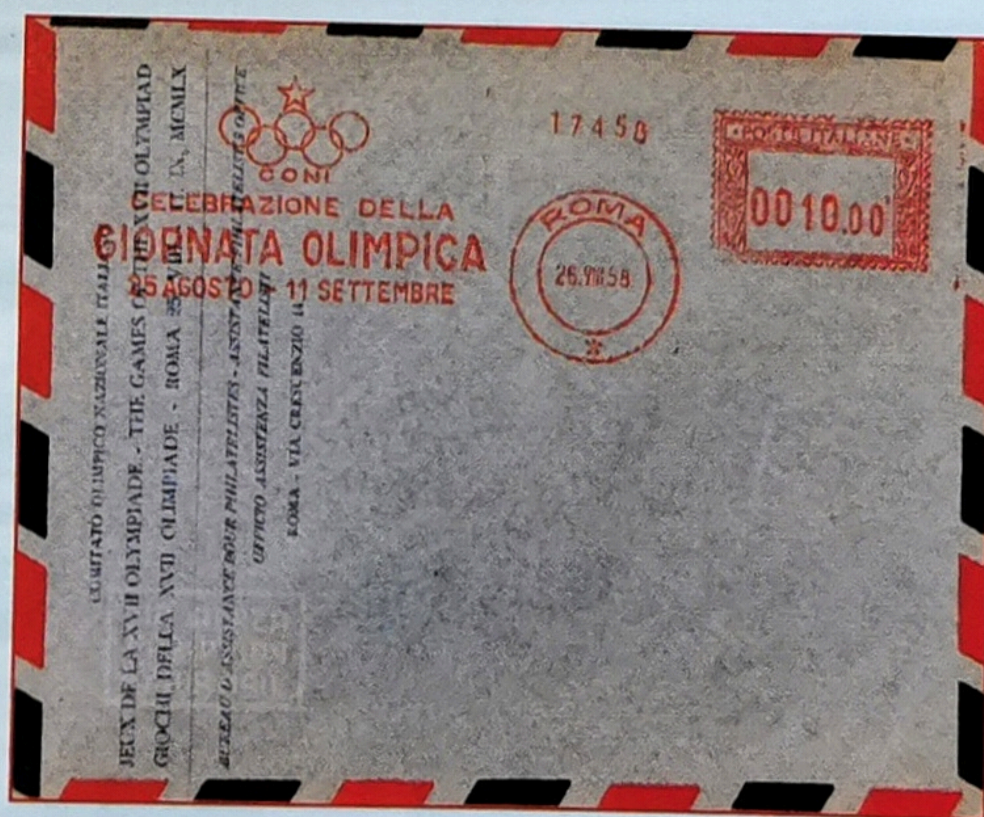
Affrancatura meccanica "Celebrazione della giornata olimpica"